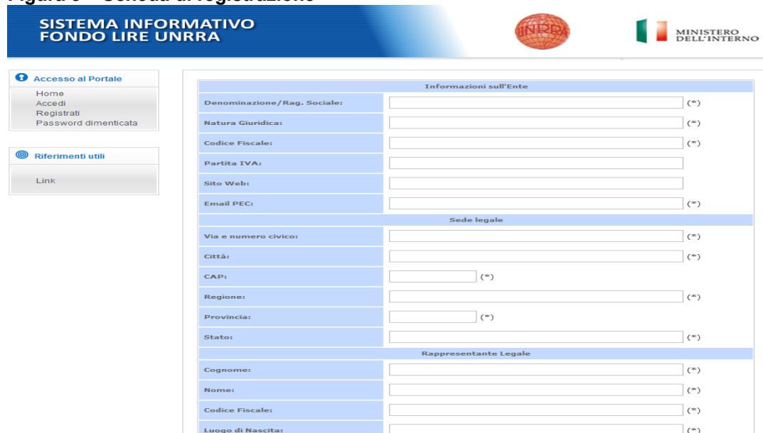
Figura 3 – Scheda di registrazione