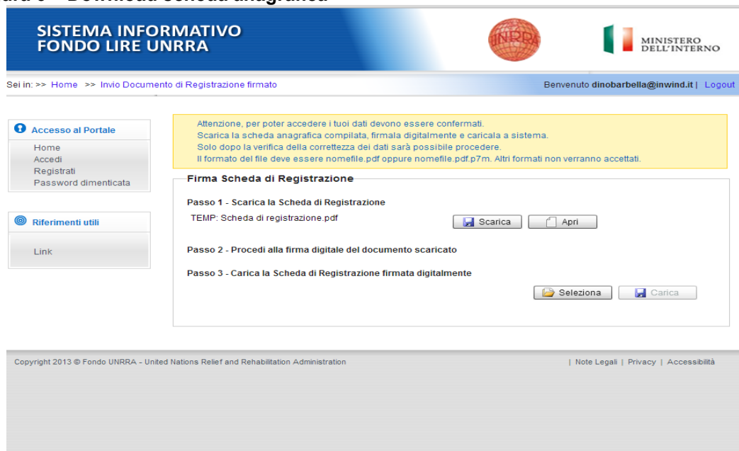
Figura 6 – Download scheda anagrafica